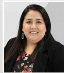
Aracely Rios Ruben Hinojosa Elementary