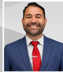
Jose Silva Lloyd and Dolly Bentsen Elementary