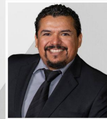
Tizoc Silva Sharyland Alternative Education Center