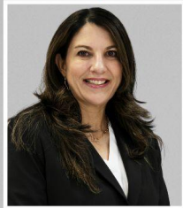
Cecilia Boyd Olivero Garza Sr. Elementary